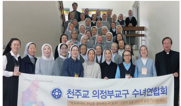
수도자는 하느님 백성 전체의 선익에 봉사합니다. _의정부교구 수녀연합회 총회(2025년)

당한 평가와 인정을 받을 때까지 많은 어려움이 있었습니다. 하지만 영적인 공동체가 자칫 위험한 길에 들지 않도록 교회 권위의 감독과 보호가 필요합니다. 영적인 공동체가 교회의 인정을 못 받아 교회 안에 뿌리를 내리지 못할 때, 그 공동체는 분파로 갈라질 위험이 있습니다. 그래서 수도 공동체의 그리스도를 향한 생활 형태가 교회의 승인을 받는 것은 매우 중요합니다.